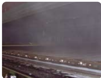
蒸気滅菌イメージ

※冷却・凍結用フリーザー製品共に、当社独自のシャトルコンベヤタイプが選べます。※本製品は特許商品です。