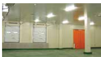
Крупное сборное холодильное и морозильное оборудование