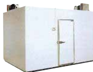
Возможна комплектация с крышей для использования на улице