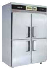
наше запатентованное изобретение