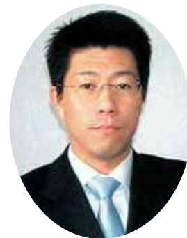
Генеральный директор Мацусита Чикахито

Объединение строительных компаний префектуры Фукуока Союз юридических лиц г. Иизука Орган по сертификации жилых строительных объектов Японии