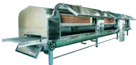
наше запатентованное изобретение